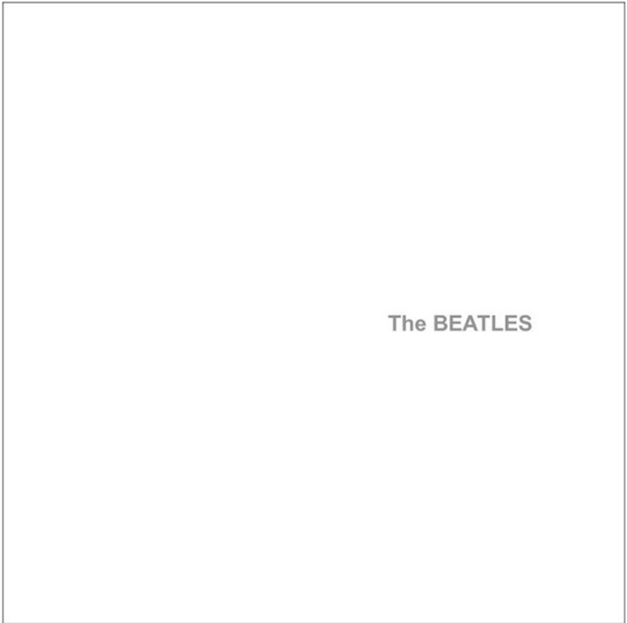
Portada del álbum blanco, 1968.

Las sesiones de grabación de este álbum no van muy bien. En 1968, John Lennon es oficialmente pareja de Yoko Ono, cada vez más presente en el estudio. La pareja de un beatle nunca antes había penetrado tanto en la intimidad de la banda, y la atmósfera es tensa. Las relaciones entre los miembros se deterioran, tanto que Ringo Starr abandona la banda durante unas semanas, antes de regresar en el otoño de 1968. La intervención de músicos externos, como el guitarrista británico Eric Clapton (nacido en 1945), invitado por George Harrison para la magnífica canción While my guitar gently weeps (1968), ayuda a aliviar estas tensiones en un principio.