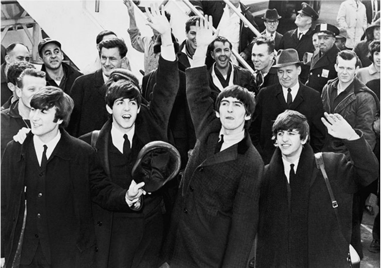
Los Beatles en el aeropuerto Kennedy, el 7 de febrero de 1964.