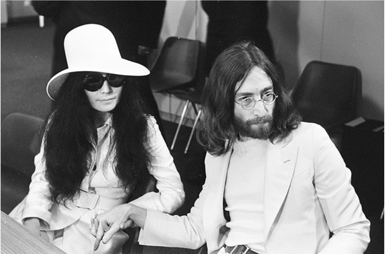
John Lennon y Yoko Ono en Ámsterdam, marzo de 1969.

Además, cada vez se divierten menos tocando con los demás. Las tensiones son tales que Ringo Starr y George Harrison abandonan la banda por unas semanas —a finales de 1968 y principios de 1969, respectivamente—, pero después regresan. Tras las sesiones de grabación de Abbey Road , es Lennon el que anuncia que deja la banda.