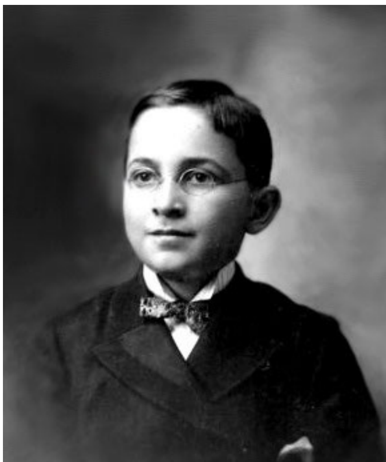
Retrato de Harry S. Truman cuando tenía 13 años.

En la escuela, Harry S. Truman es un estudiante promedio. Poco integrado debido a un problema ocular pronunciado, trata de destacar en lectura y música, pero realmente no brilla en ninguna de estas áreas.