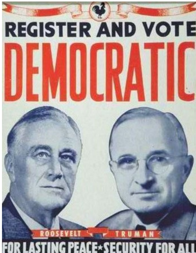
Cartel de Franklin D. Roosevelt y Harry S. Truman para las elecciones de 1944.

Truman ejerce este cargo hasta el 12 de abril de 1945, cuando fallece el presidente. Puesto que la Constitución del país establece que, en caso de fuerza mayor, el vicepresidente es quien tiene que asegurar la continuidad del poder, Harry S. Truman se convierte en el 33.º presidente de los Estados Unidos cuando está a punto de cumplir 61 años.