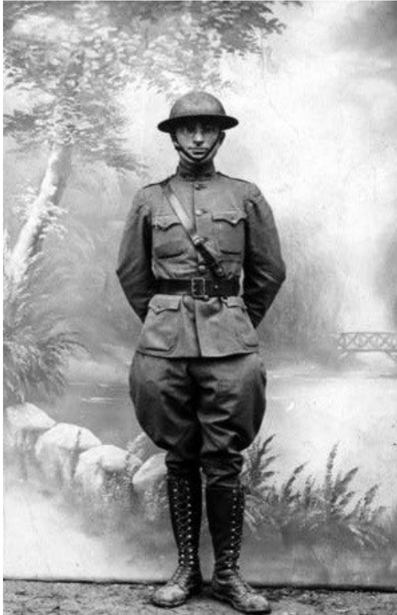
Harry S. Truman en uniforme militar.

De vuelta en los Estados Unidos en 1919, se casa con su amiga de la infancia Elisabeth Virginia Wallace (1885-1982), más comúnmente conocida como Bess, y abre un negocio de ropa con uno de sus colegas del ejército. No obstante, el negocio quiebra y Truman se queda sin trabajo.