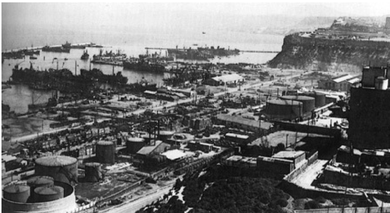
El puerto de Orán en 1943.