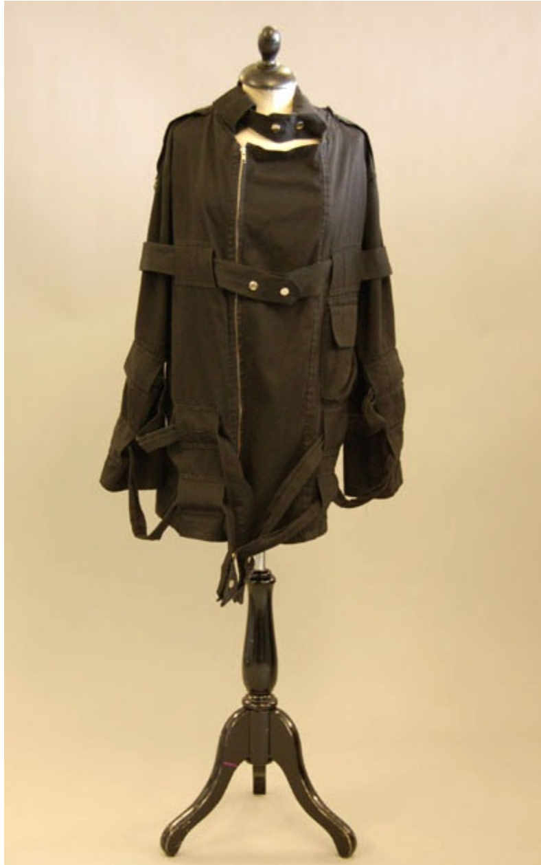
Abrigo de estilo bondage .

Este conjunto se convierte en una vestimenta punk de referencia a finales de los setenta, antes de que Jean-Paul Gaultier tomara el poder en los ochenta. Con él, el movimiento punk se invita a los podios de los desfiles con modelos tatuados que lucen orgullosamente sus piercings .