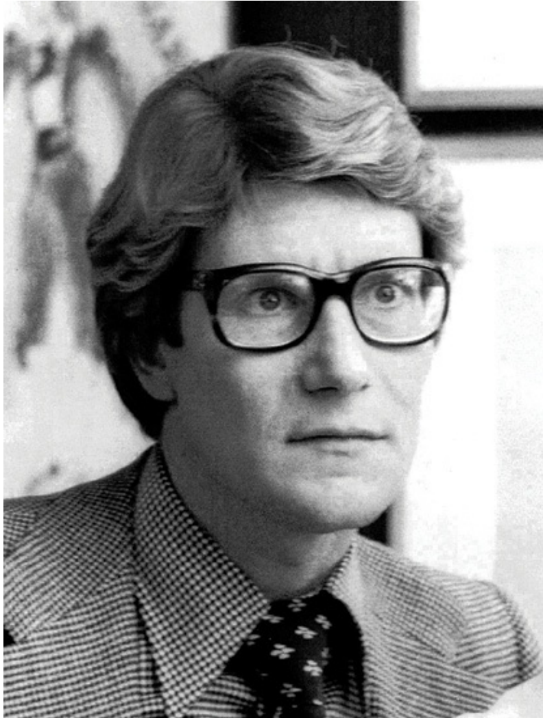
Yves Saint Laurent c. 1982.