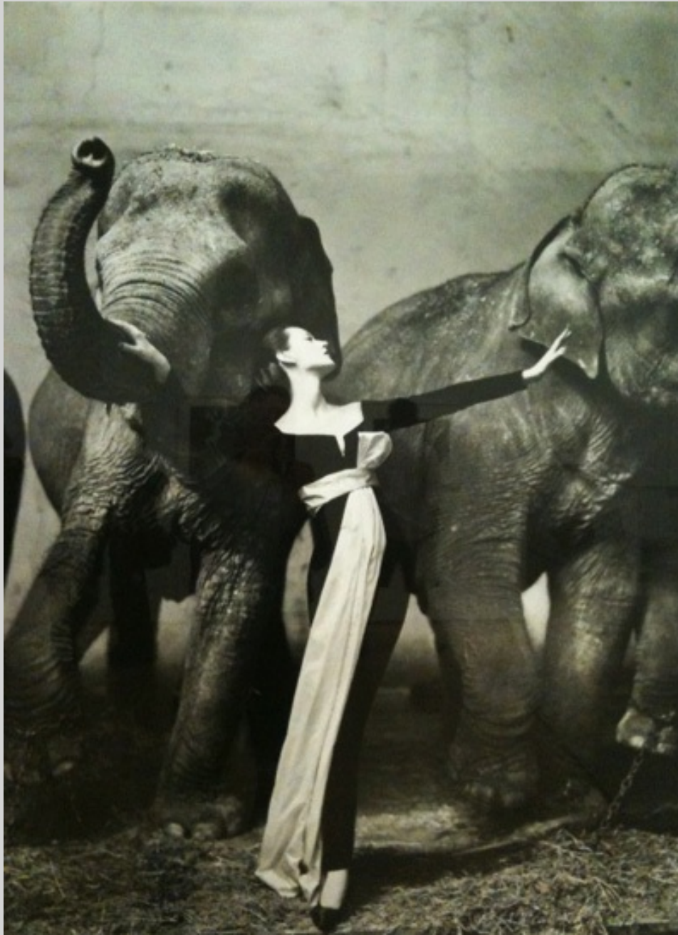
Dovima y los elefantes , de Richard Avedon (1955).