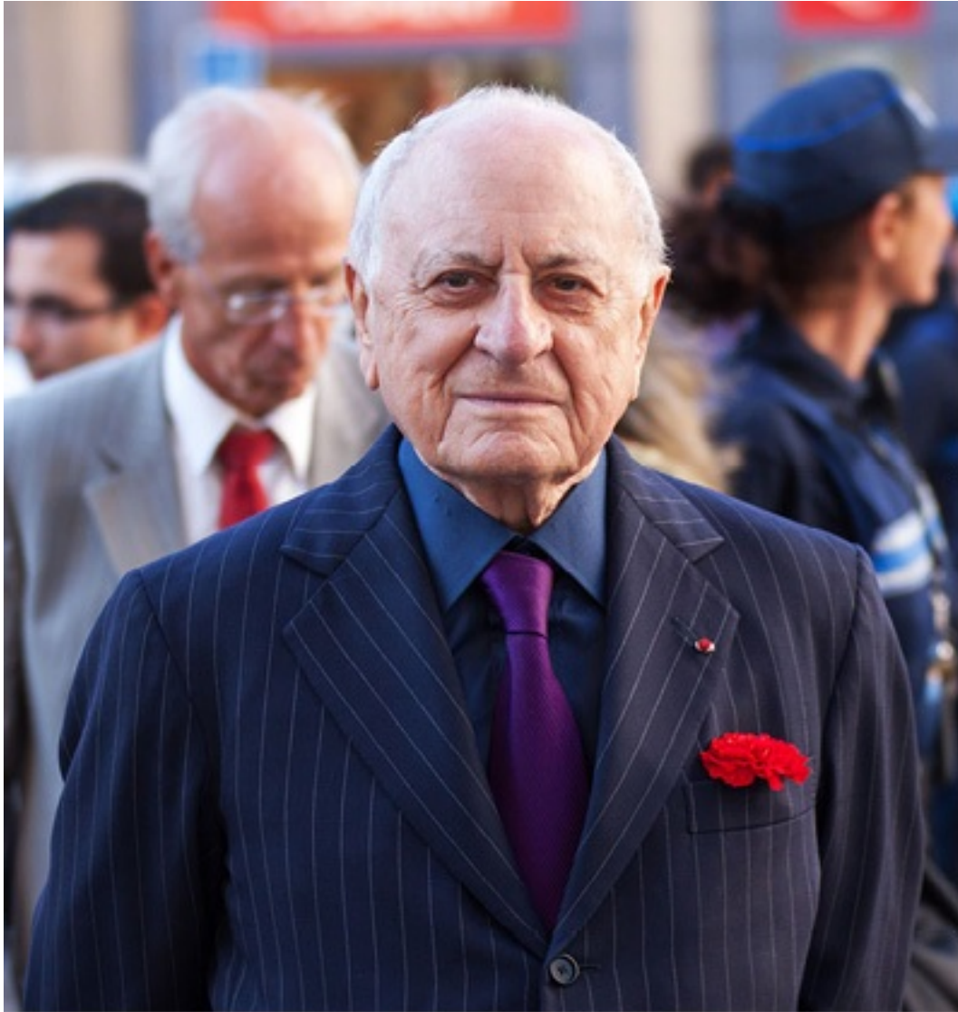
Pierre Bergé en la inauguración del Museo Stendhal de Grenoble, en septiembre de 2011.

Hoy en día, los espacios de exposición de la fundación son sustituidos por un museo dedicado a la obra de Yves Saint Laurent, inaugurado en octubre de 2017. Este espacio está dedicado a la obra del gran modista con maquetas, bocetos, fotografías y películas sobre su persona; todo ello presentado en una exposición permanente. La visita al estudio de trabajo de Yves Saint Laurent, en la avenida Marceau (en el VIII Distrito de París), también forma parte del recorrido.