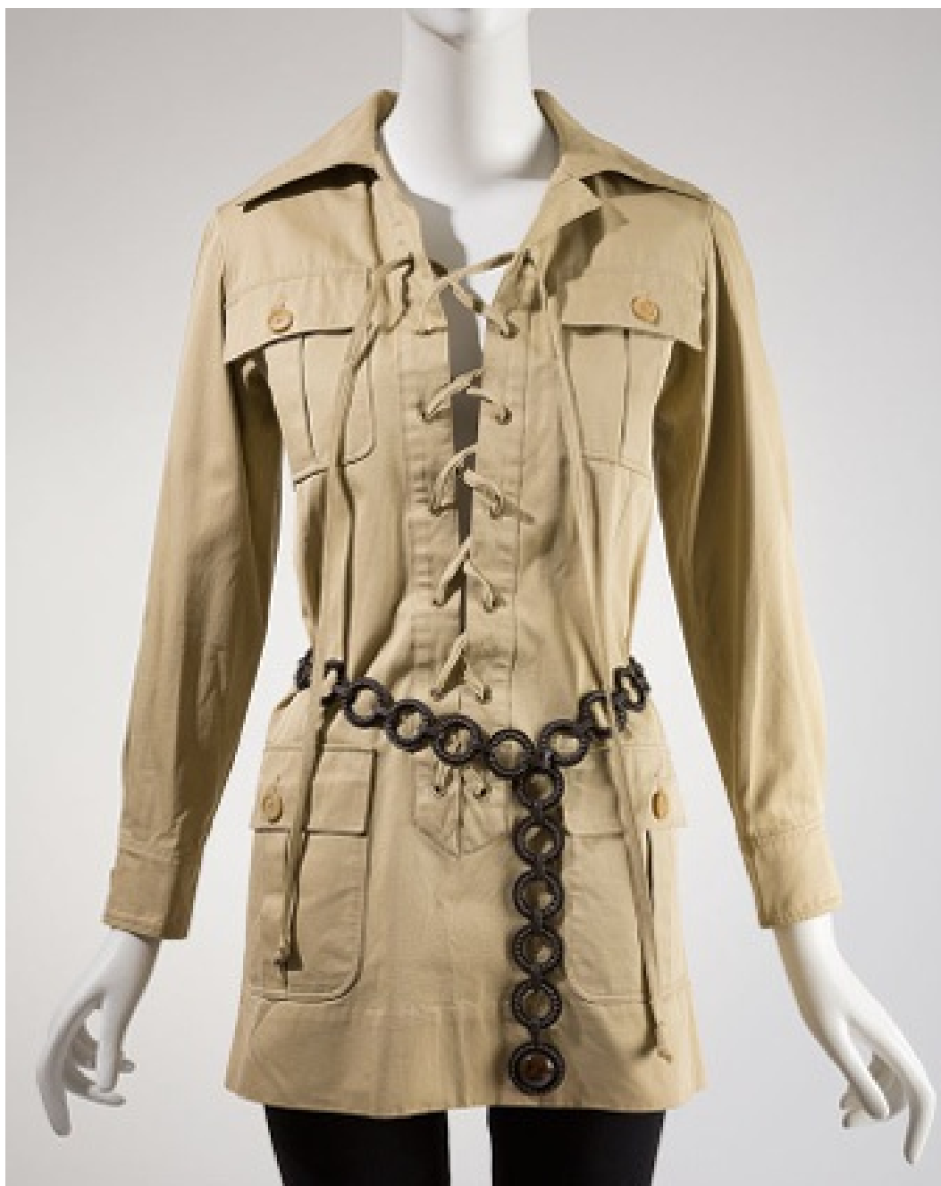
La sahariana de 1968.

camisa y unas mallas de algodón. Después se refleja en una gabardina de algodón, una especie de trench de tela color beige con cuatro grandes bolsillos con fieltro (colección primavera/verano 1967), uniendo arte africano y vestimenta de exploradores. En 1968, Yves Saint Laurent crea específicamente para la revista Vogue París una sahariana con un profundo escote con cordón y un cinturón de anillos de metal. En julio-agosto de 1968, se publican fotografías del modelo, que figura en los archivos de la casa YSL como «fuera de colección».