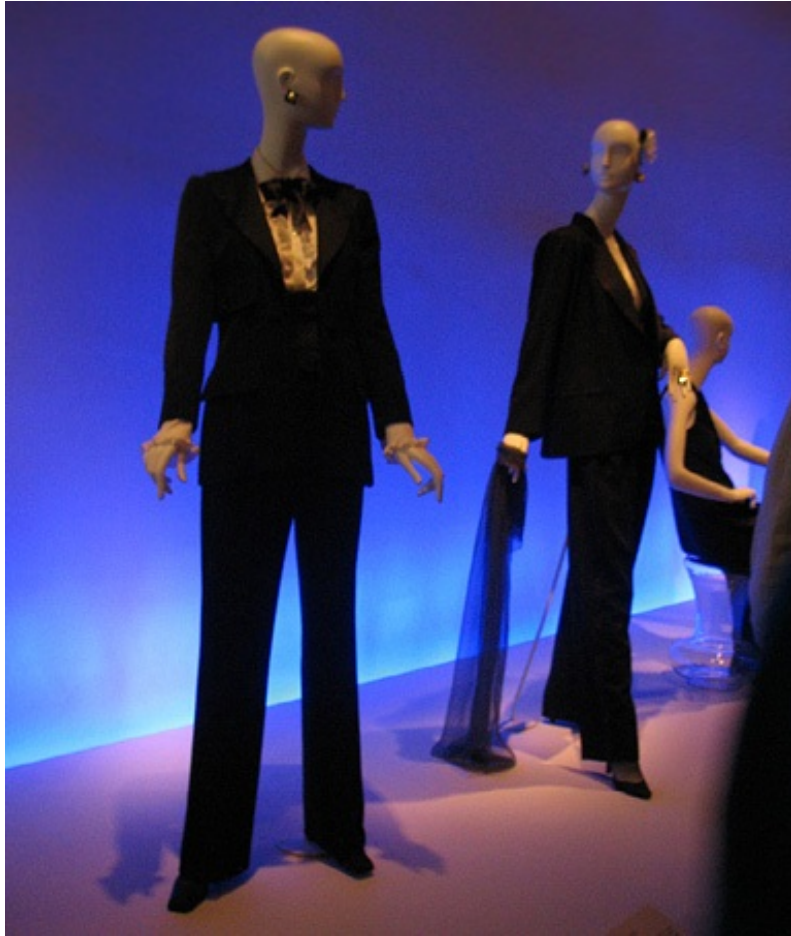
El esmoquin femenino de Yves Saint Laurent en el museo M. H. De Young de San Francisco.

En julio de 1968 (colección otoño/invierno), el jumpsuit , un mono pantalón, perpetúa el estilo de la prenda funcional en la moda femenina. Este, originalmente empleado por los aviadores, se asemeja a los monos de trabajo de los obreros de la construcción. Yves Saint Laurent se inspira en particular en los artistas constructivistas rusos de los años veinte —que son los primeros en querer transformar esta prenda funcional en un traje para el hombre del siglo XX— para perfeccionarlo de una forma nunca vista y convertirlo en una prenda de noche de punto de seda negro (1968), y luego en un mono de punto de seda marrón (1969).